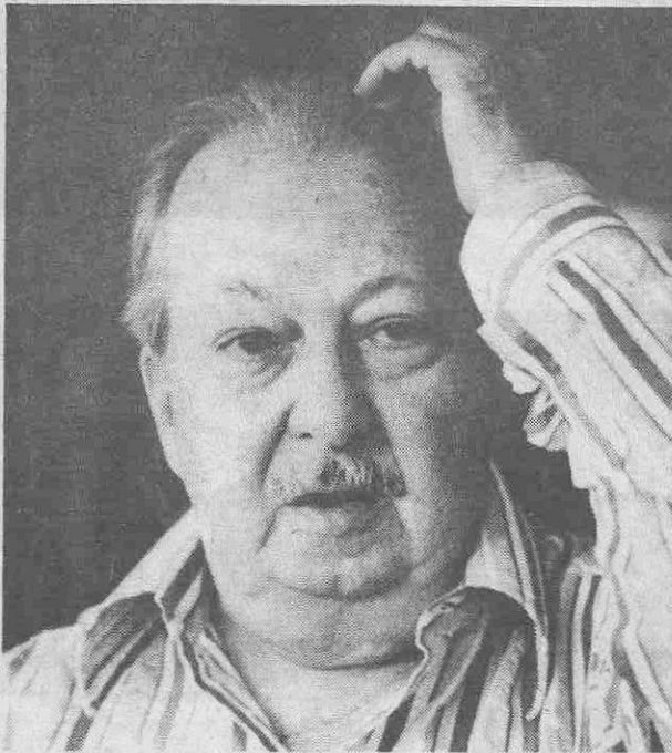
Gerbasi, Otero Silva y Beltrán Guerrero podrían resultar favorecidos por el galardón cervantino.

Vicente Gerbasi, Miguel Otero Silva y Luis Beltrán Guerrero fueron nominados por Venezuela para el galardón más importante en la lengua española. Eugenio Montejo, Juan Calzadilla, Ludovico Silva y Juan Liscano dieron a conocer sus justas preocupaciones por el inminente veredicto.